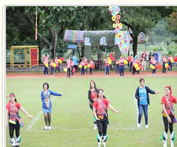
社區媽媽表演阿美族傳統舞蹈