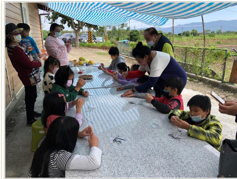
公益彩券回饋金補助計畫「歸返花蓮阿美族七腳川社織布之路」