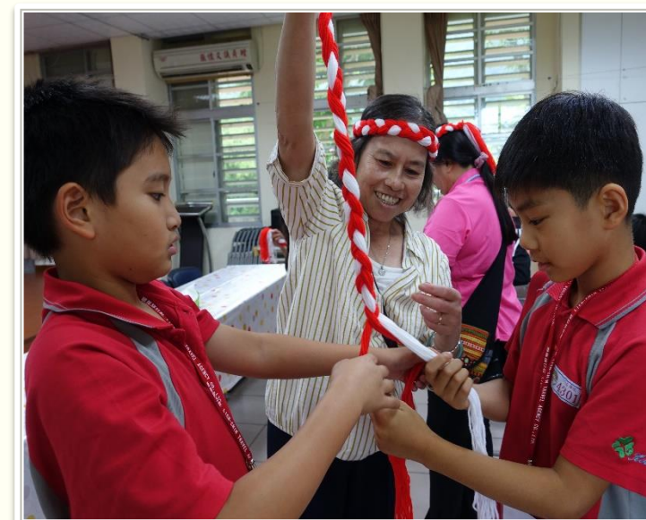
阿美族傳統頭飾製作