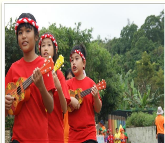
學生配戴阿美族頭飾