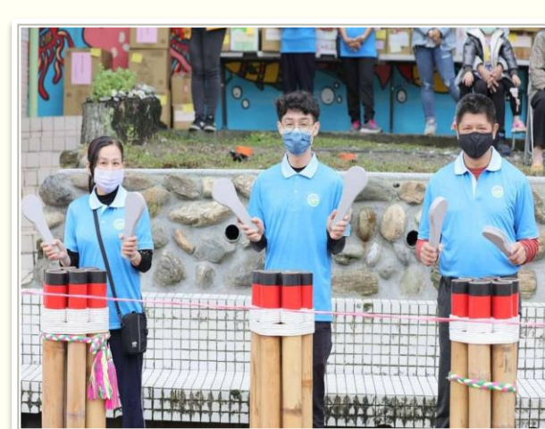
阿美族傳統樂器Kakeng開場